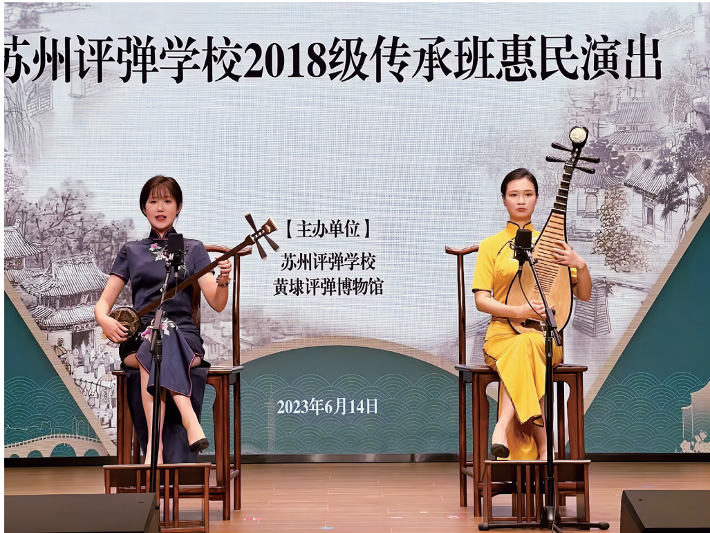
图8 传承班在黄埭评弹博物馆惠民演出