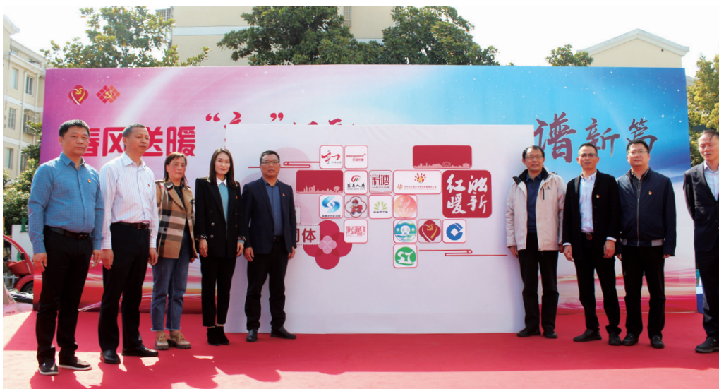
图22 党建共建活动现场

未来，学校将扎实开展新形势下党建工作，发扬“四敢”精神，把“校+社”融合共建活动作为推进党建共同发展的重要举措，实现党建与教育的深度融合，共促党建活动创新！