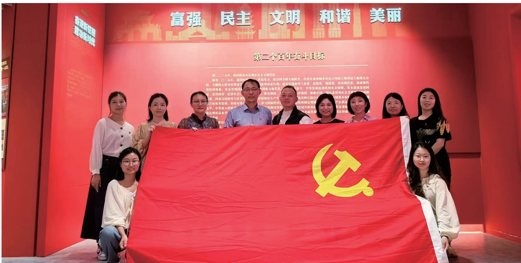
图25 参观苏州革命博物馆

9月15日，苏州评弹学校全体党员、青年理论学习小组成员赴苏州革命博物馆参观学习。本次参观学习使全体人员深刻意识到从严治党的重要性。充实认识到在未来的工作和生活中，应不断提升党性修养和思想境界，保持对远大理想和奋斗目标的执着追求，同时要知敬畏、存戒惧、守底线，永葆共产党人清正廉洁政治本色。