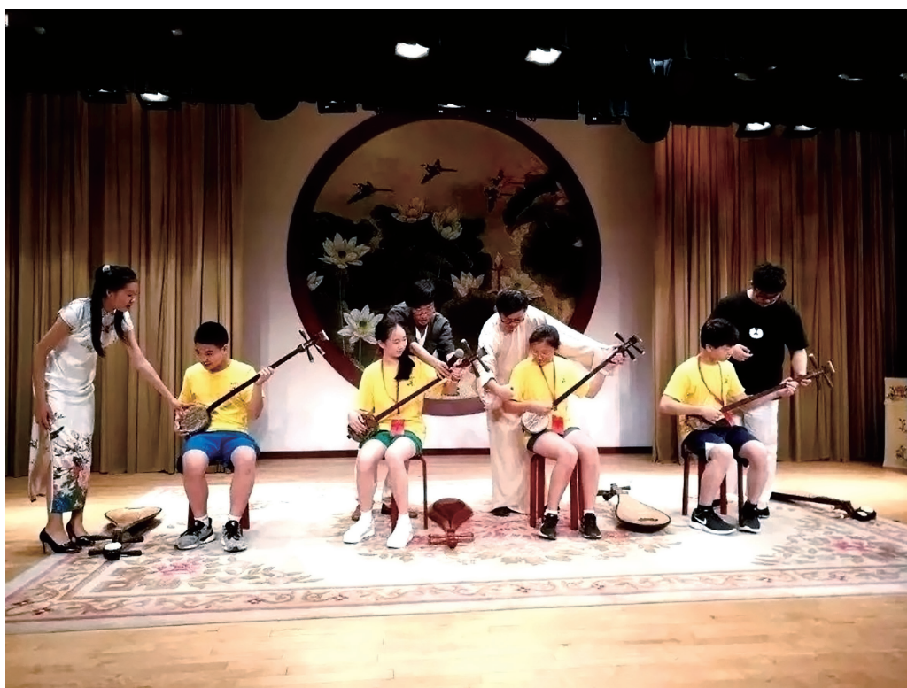
图17 中小学生在来校体验苏州评弹

裕馨文化志愿服务队的一大特色是服务于少年儿童的苏州话推广。利用丰富的苏州童谣资源，以活泼生动的形式教苏州话、用苏州话。面向老苏州则设计“新人唱经典”“新人说新书”的内容，为老苏州送上评弹经典书目与志愿者编创演的新节目，丰富了社区文化。同时，为了进一步满足老苏州们深入接触评弹文化的需求，志愿服务队与社区共同设计体验式评弹教学模块，深入浅出地指导老苏州自己讲自己的故事、居民讲身边的故事。志愿服务队与百步街社区开展的“家风”社区故事会，从志愿者表演到居民教学，最后居民自己表演，形成了送文化、种文化、孵文化的新型模式。