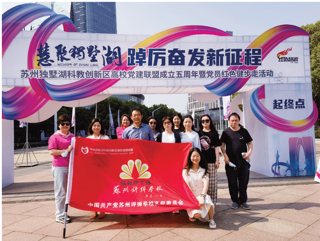
图19 苏州评弹学校党组织加入科教创新区高校党建联盟

2023年是贯彻党的二十大精神的关键之年，是实施“十四五”规划承前启后的关键一年，是为全面建设社会主义现代化国家奠定基础的重要一年。在苏州市委市政府“四敢”精神的坚强领导下，在苏州市文广旅局的监督指导下，苏州评弹学校认真落实全面从严治党和党风廉政建设的部署要求，大力推进党建工作走深走实，全面提升党建工作质量，为奋力谱写新时代苏州评弹优秀人才培养篇章提供坚强的政治和组织保证。