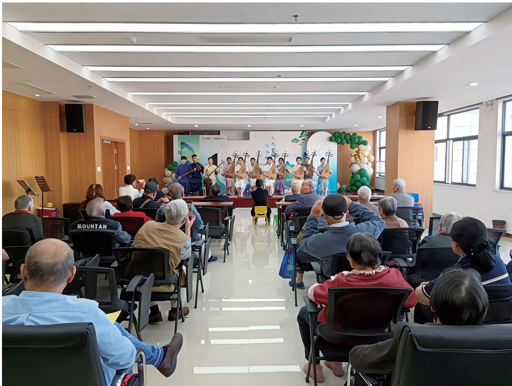
图9 20级传预班在江陵康养中心社会实践