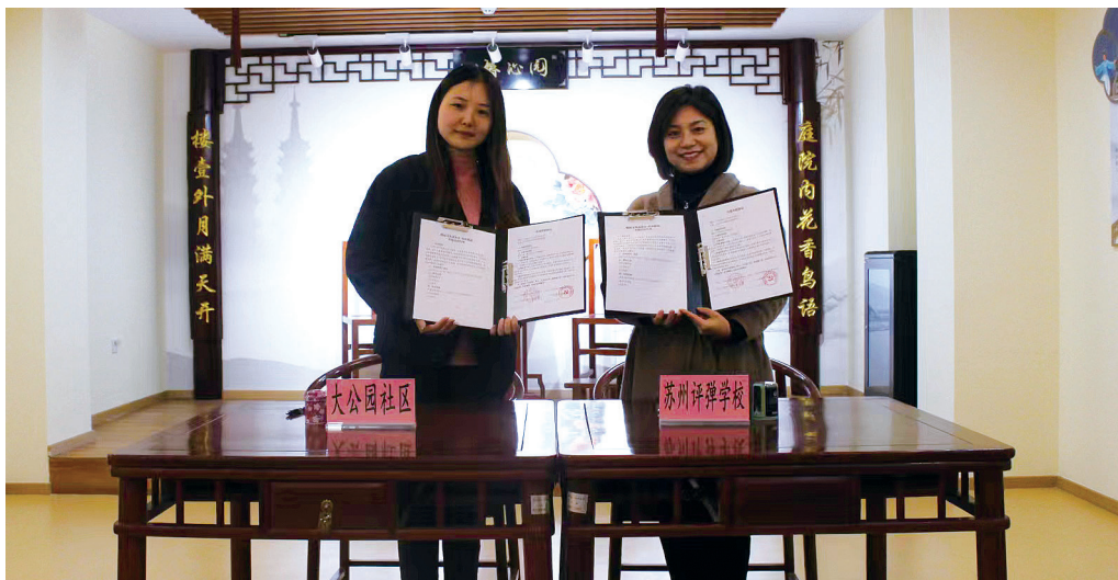
图23 党建共建活动签约现场