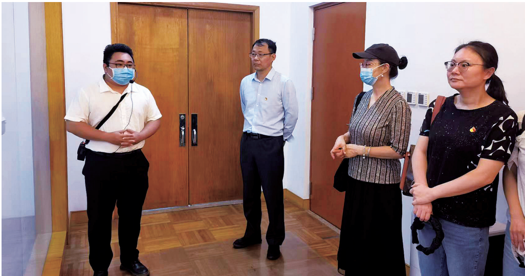
图24 参观陈云纪念馆

7月1日，苏州评弹学校全体党员、在职干部职工赴陈云纪念馆学习参观。大家在解说员的带领下认真有序参观，聆听讲解、驻足思考，瞻仰陈云同志为党和人民不懈奋斗的光辉一生，缅怀陈云同志的不朽功勋和崇高风范，感悟“坚守信念、党性坚强、一心为民、实事求是、刻苦学习”的陈云精神。