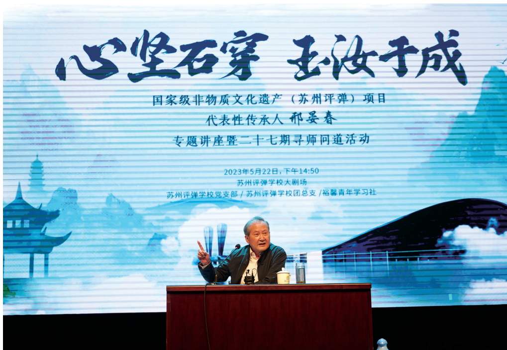
图13 “心坚石穿 玉汝于成”讲座现场