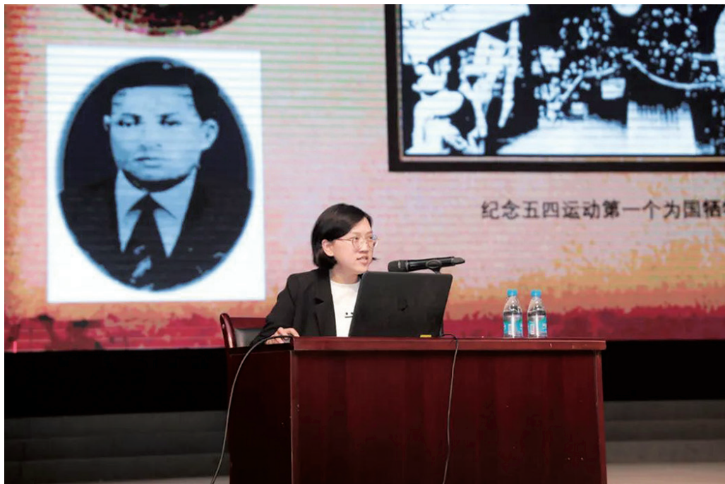
图14 “坚持铸魂育人，传承红色基因”讲座现场

此次活动是苏州评弹学校推进党建与业务深度融合“坚持铸魂育人 传承红色基因”党建重点项目中的一场主题活动，今后，学校将继续开展以红色文化、校史资源作为有效载体，推动新时代学校思政工作，以高质量党建促进学校教育的高质量发展。