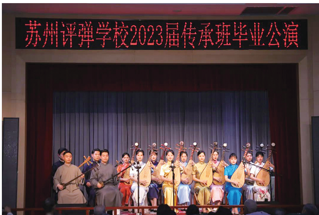
图18 苏州评弹学校2023届传承班毕业公演

2023年6月19日，匠心独运·薪火相传——2023届传承班毕业公演在梅竹书苑璀璨启幕。校领导、学生家长代表、社会观众等一起观看演出，共同见证毕业学子华丽蜕变的一刻。齐奏《三六》、琴调开篇《潇湘夜雨》、蒋调开篇《杜十娘》、中篇选曲《杨八姐游春·游春》、中篇选曲《林冲·长亭泣别》、中篇选回《唐伯虎点秋香·选美》、长篇选回《十美图·盘夫》、长篇选回《文武香球·桂英进京》等一出出经典书目轮番上演。本次演出的成功举办，不仅充分展示了学校学子扎实的基本功底及表演技能，同时也是校团联合共育的教学水平最好的印证。