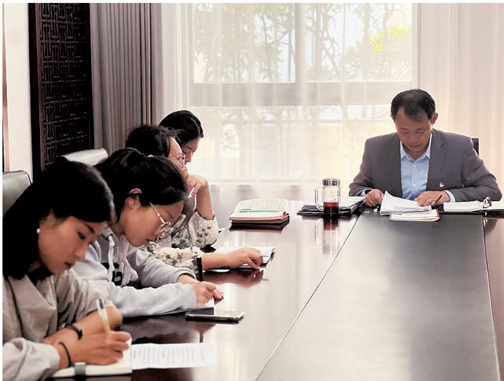
图20 开展“牢记嘱托、感恩奋进、走在前列”集体讨论