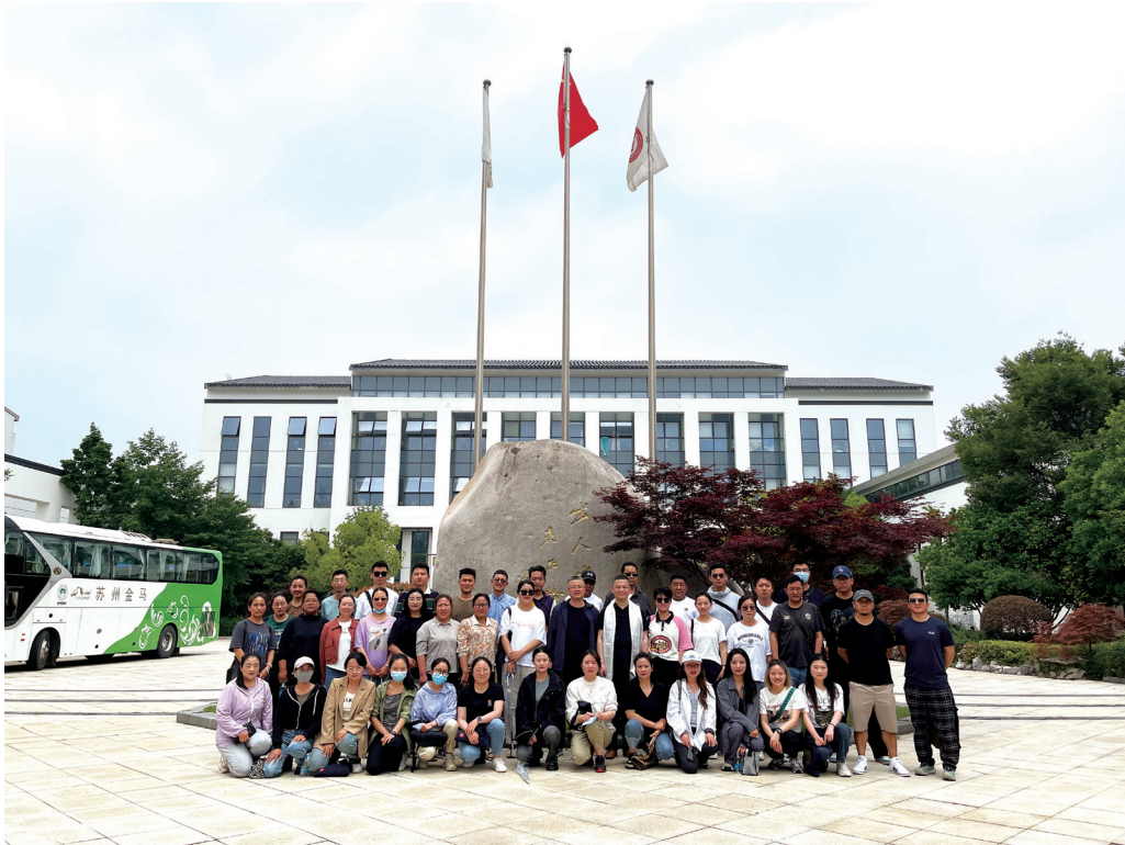
图2 拉萨市第二中等职业技术学校骨干教师高级研修班合影

为进一步发挥优势区域教育辐射作用，助力中西部教师的专业成长，拉萨市第二中等职业技术学校骨干教师高级研修班日前在苏州大学正式开班。6月7日上午，研修班一行来到苏州评弹学校进行现场学习观摩，体验苏州评弹魅力的同时，感受特色校园文化。