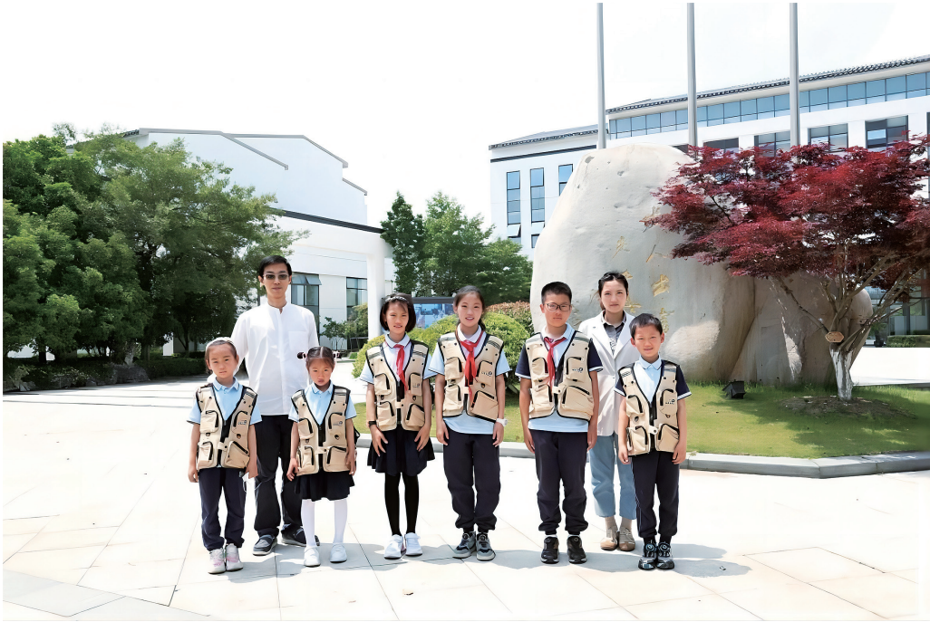
图4 苏州工业园区青剑湖小学学生代表合影

苏州评弹是苏州文化的骄傲，也是第一批国家级非遗项目之一，学校衷心希望通过这样的参观交流活动，能有更多中小学校参与到优秀传统文化的普及和教育工作中来，为传承和发扬苏州非遗文化贡献一份力量！